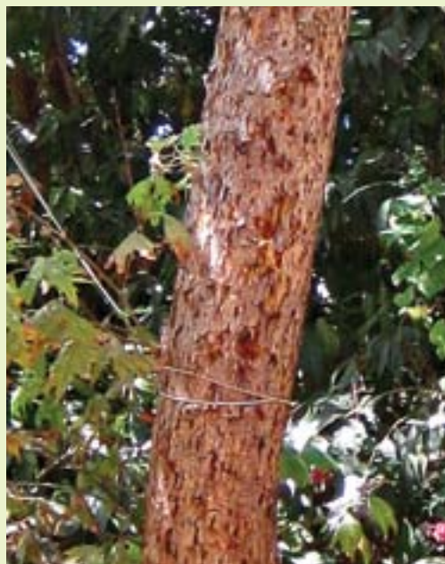
תמונה 14. גזע פגוע של דולב מזרחי