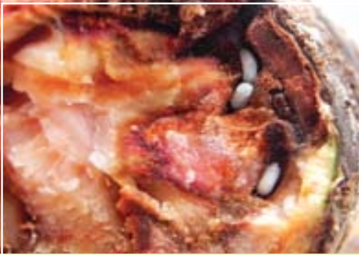
תמונה 4. נקודת שבירה בענף של אלון; זחלים, גלמים ובוגר צעיר של החיפושית בתוך המחילה