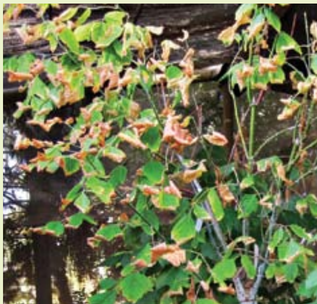
תמונה 9. תסמיני נזק בעלווה של אדר מילני

הפטרייה מתפתחת ברקמת העצה באזור דופן המחילות. בדופן הגלריה נראה תפטיר שצבעו לבן וממנו ניזונים הזחלים. הפטרייה כמעט שאינה מתפשטת מעבר לאזור הגלריות ואינה נמצאת בחלקי העץ שלא אוכלסו עידי החיפושית. אין נתונים דומים לגבי מיני הפוזריום הסימביונטיים האחרים.