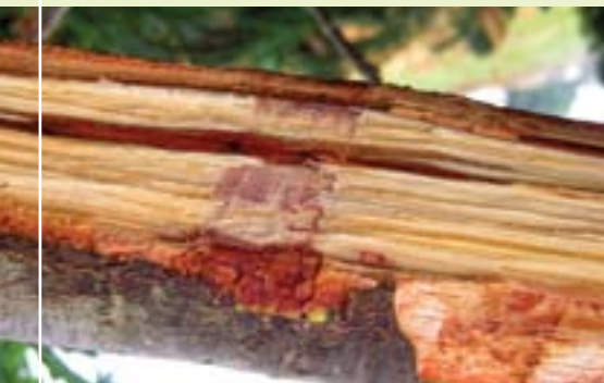
תמונה 6. החמה של העצה של אלון ארך עוקצים בעקבות פעילות הפטרייה

משך ההתפתחות של החיפושית הוא כ-9-10 שבועות. הזמן החולף מהחדירה עד תחילת ההטלה עשוי להימשך שבועיים ויותר, כאשר מותקף עץ או ענף שבהם טרם התבססה הפטרייה. ההטלה מתרחשת כאשר התבססות הפטרייה היא טובה. מצאנו שהחיפושיות הצעירות אינן ממהרות לעזוב את מערכת המחילות. לאחר ההזדווגות עם הזכרים שבסביבתן הקרובה בתוך מערכת המחילות, נוטות החיפושיות להעמיד דור חדש בעומק העצה, כל עוד מצבו הפיזיולוגי של הפונדקאי (לעתים מדובר בענף מסוים) הוא טוב. הגיחה והתעופה אל פונדקאים חדשים מותנות בעיקר בהידרדרות במצבו של הענף (או הגזע), ובעיקר בהתייבשות של העצה. לחיפושיות יש נטייה לחזור ולחדור לעצים קרובים שאוכלסו זה מכבר, אך חלקן מעופפות למרחק של קילומטר ויותר.