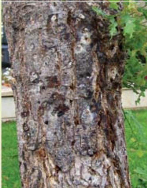
תמונה 12. גזע נגוע של אלון ארך עוקצים; לבלוב לאורך הגזע מאפיין עצים שנתקפו ע"י הפגע