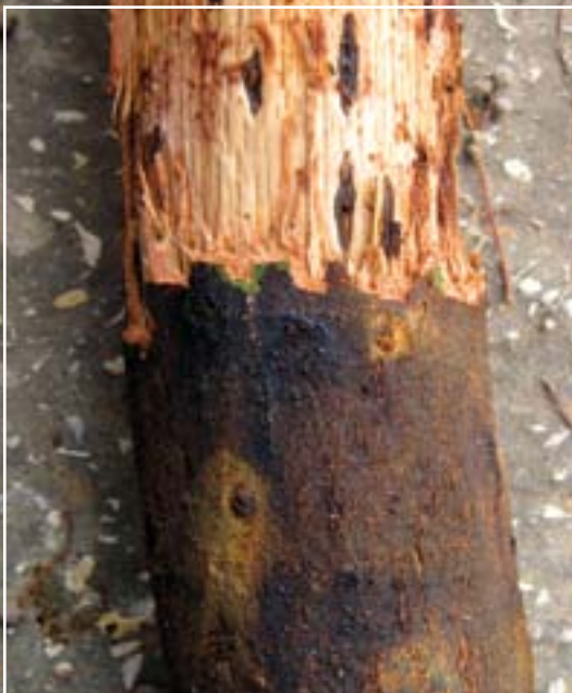
תמונה 13. ענף של אלון ארך עוקצים מכוסה בכיבים, שבחלקו הוסרה הקליפה