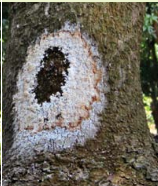
תמונה 19. כיב עם הפרשת סוכר (פרסיטול) טיפוסית באבוקדו