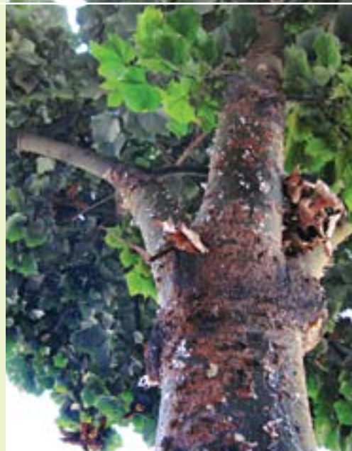
תמונה 16. סימני פגיעה אופייניים בברכיכיסטון