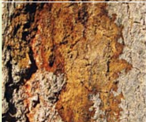
תמונה 8. הפרשת גומי בגזע של אדר מילני