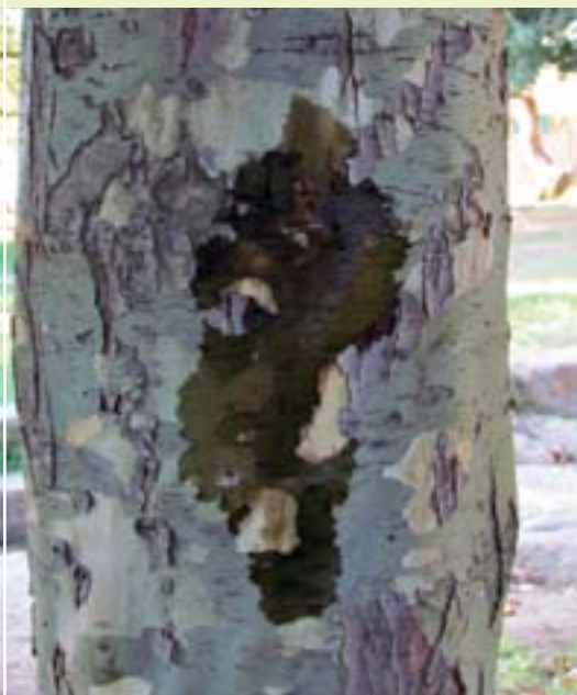
תמונה 15. סימני חדירה ראשוניים בדולב מזרחי