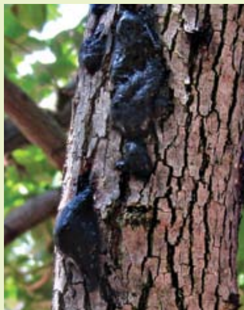
תמונה 18. הפרשת גומי בעקבות ניסיון חדירה לענף אפרסמון