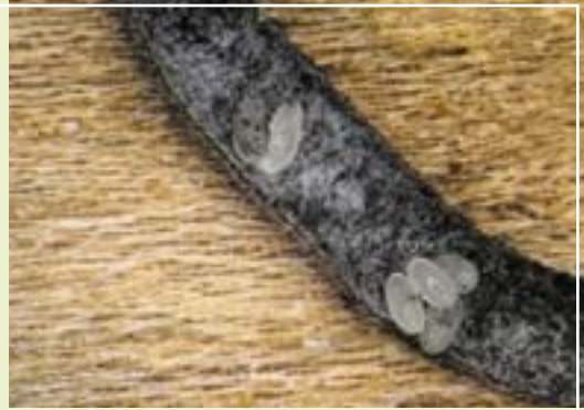
תמונה 3. כיבים שנגרמו ע"י פגע האמברוזיה על ענפי אלון ארך עוקצים

משך ההתפתחות של החיפושית הוא כ-9-10 שבועות. הזמן החולף מהחדירה עד תחילת ההטלה עשוי להימשך שבועיים ויותר, כאשר מותקף עץ או ענף שבהם טרם התבססה הפטרייה. ההטלה מתרחשת כאשר התבססות הפטרייה היא טובה. מצאנו שהחיפושיות הצעירות אינן ממהרות לעזוב את מערכת המחילות. לאחר ההזדווגות עם הזכרים שבסביבתן הקרובה בתוך מערכת המחילות, נוטות החיפושיות להעמיד דור חדש בעומק העצה, כל עוד מצבו הפיזיולוגי של הפונדקאי (לעתים מדובר בענף מסוים) הוא טוב. הגיחה והתעופה אל פונדקאים חדשים מותנות בעיקר בהידרדרות במצבו של הענף (או הגזע), ובעיקר בהתייבשות של העצה. לחיפושיות יש נטייה לחזור ולחדור לעצים קרובים שאוכלסו זה מכבר, אך חלקן מעופפות למרחק של קילומטר ויותר.