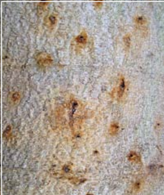
תמונה 17. סימני חדירה בגזע קיקיון