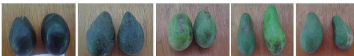
Figura 1. Variabilidad fenotípica de frutos de aguacate tipo ‘Criollo’ colectados en huertos en Pichincha e Imbabura, Ecuador.